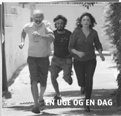
EN UGE OG EN DAG