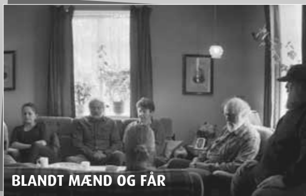
BLANDT MÆND OG FÅR